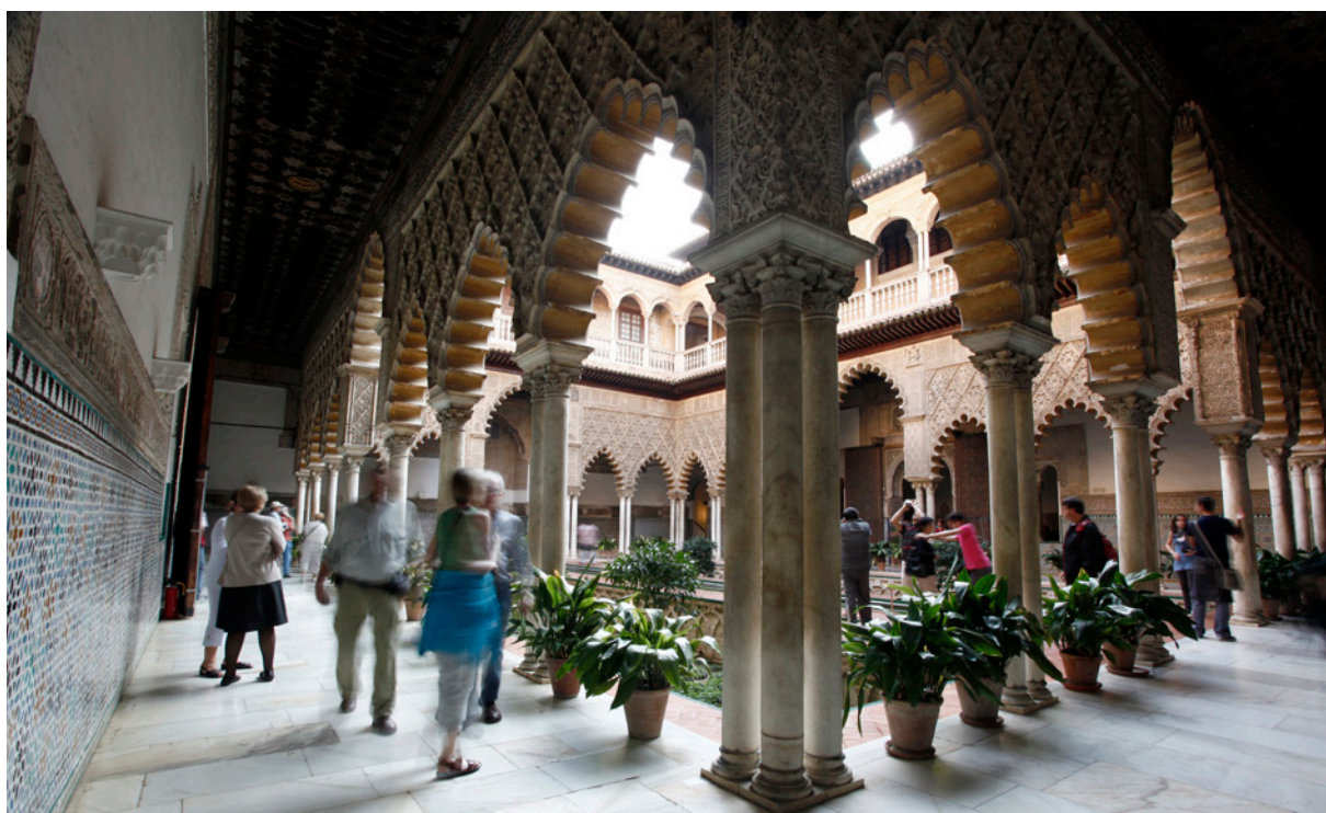
▲ ALCÁZAR REALE DI SIVIGLIA

Siviglia si caratterizza per i suoi affascinanti quartieri. Quello di Santa Cruz , in pieno centro, con vicoletti, palazzi e cortili fioriti; quello di Triana , sulla riva opposta del Guadalquivir, dall'aria marinara con note di flamenco; oppure quello di La Macarena , popolare ma ricco di storia.