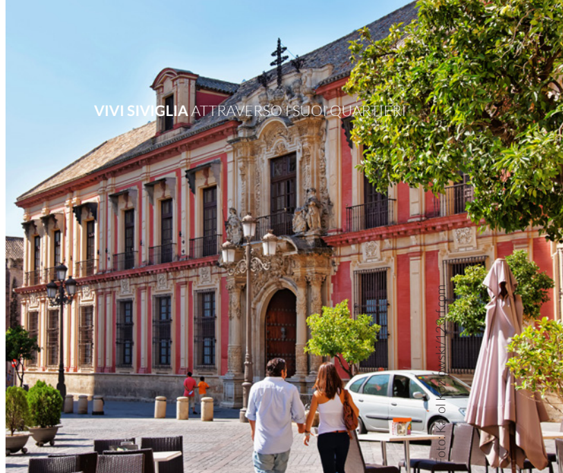
▲ PALAZZO ARCIVESCOVILE

Nella tua visita al centro non può mancare via Sierpes . Vivacissima strada pedonale molto frequentata dai sivigliani, è l'ideale per esplorare diversi negozi, bar e ristoranti. Proseguendo su questa via si arriva alla piazza di La Campana,