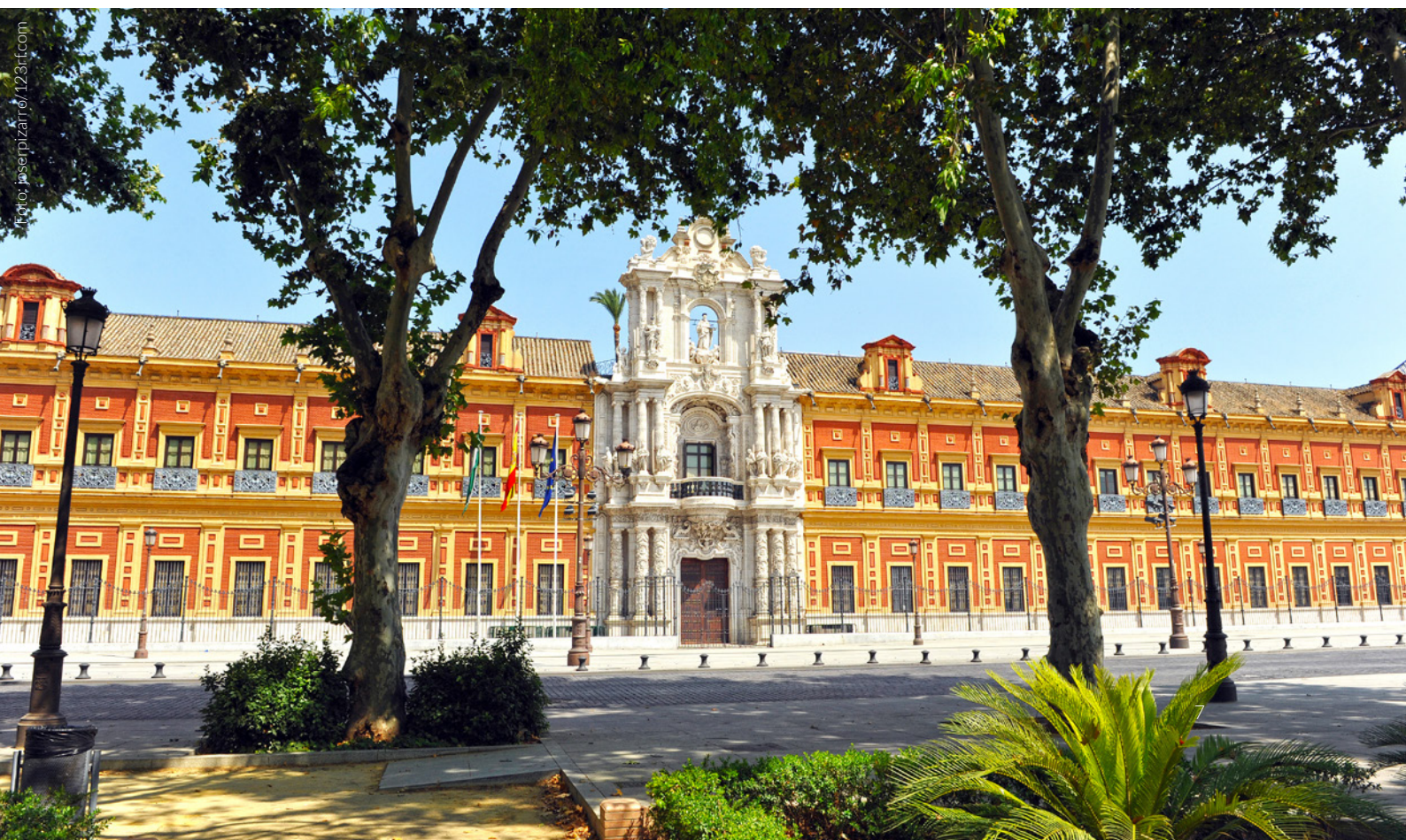
▼ PALAZZO DI SAN TELMO

Riserva anche un po' di tempo all' Alameda de Hércules , lo spazio alternativo per eccellenza di Siviglia, una spettacolare miscela di luoghi storici, proposte culturali e vita notturna. Ci sono tantissimi bar con musica dal vivo e spazi per la musica elettronica.