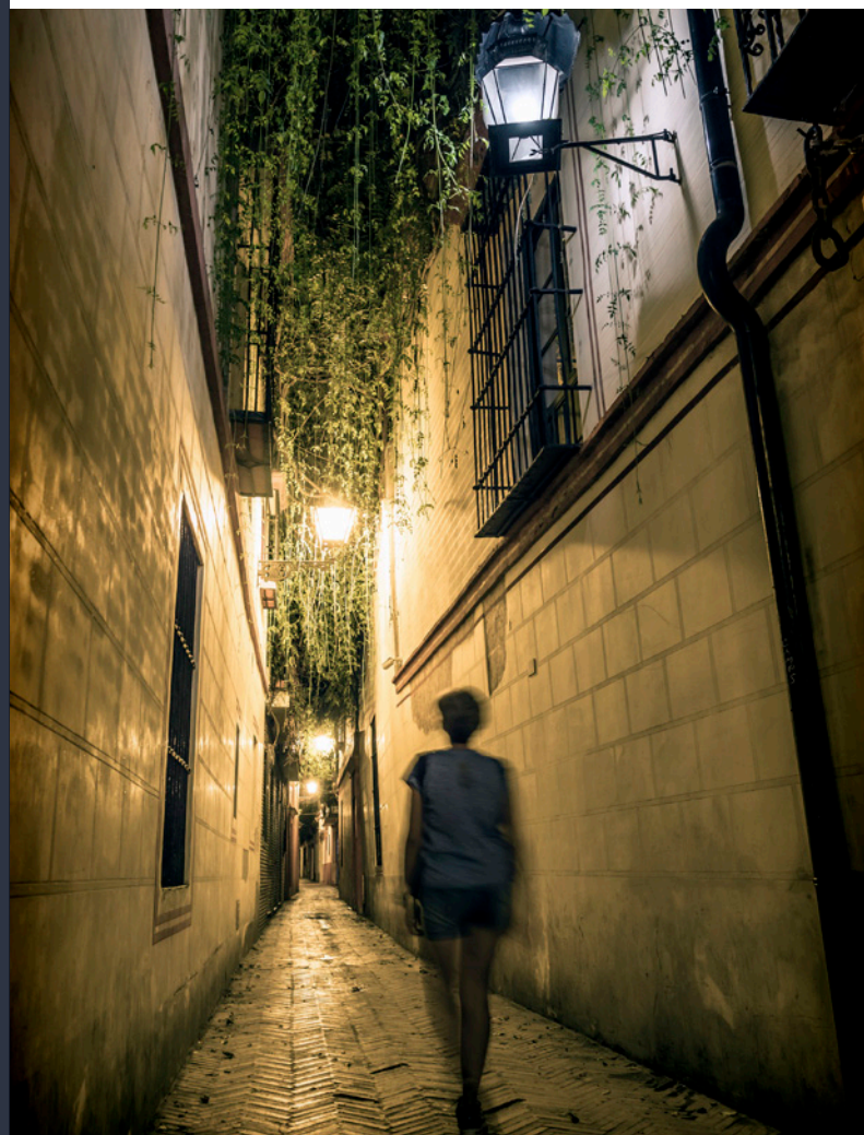
▲ QUARTIERE DI SANTA CRUZ

Il palazzo Miguel de Mañara è un altro edificio monumentale, utilizzato come residenza nobile dal 1623. Infine, la chiesa di Santa María la Blanca , edificata su un'antica sinagoga del XIII secolo, mantiene la struttura originale, nonostante sia stata ricostruita in due occasioni, la prima nel XIV secolo e poi, trasformata in uno degli esempi più rappresentativi del barocco sivigliano, nel XVII secolo.