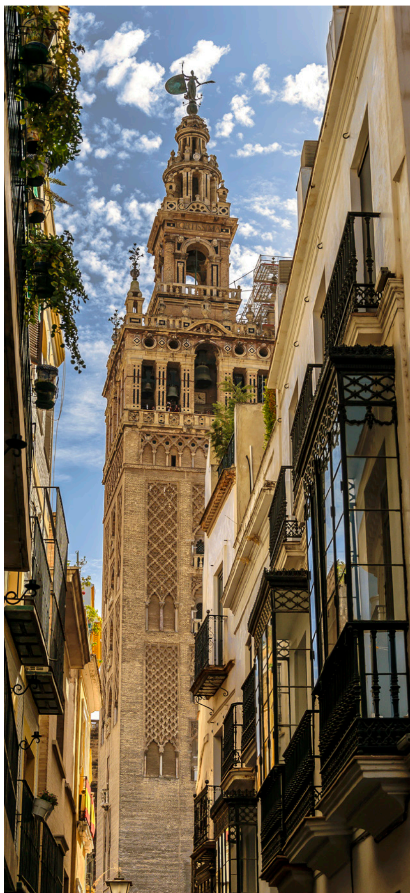
▲ LA GIRALDA

Esplora la città e assaggia nei bar del centro storico una gran varietà di deliziose tapas . Il cuore di Siviglia batte nelle sue strade. Immergiti nella vivacissima atmosfera dei bar all'aperto con vista su monumenti simbolici, come la cattedrale e la Giralda .