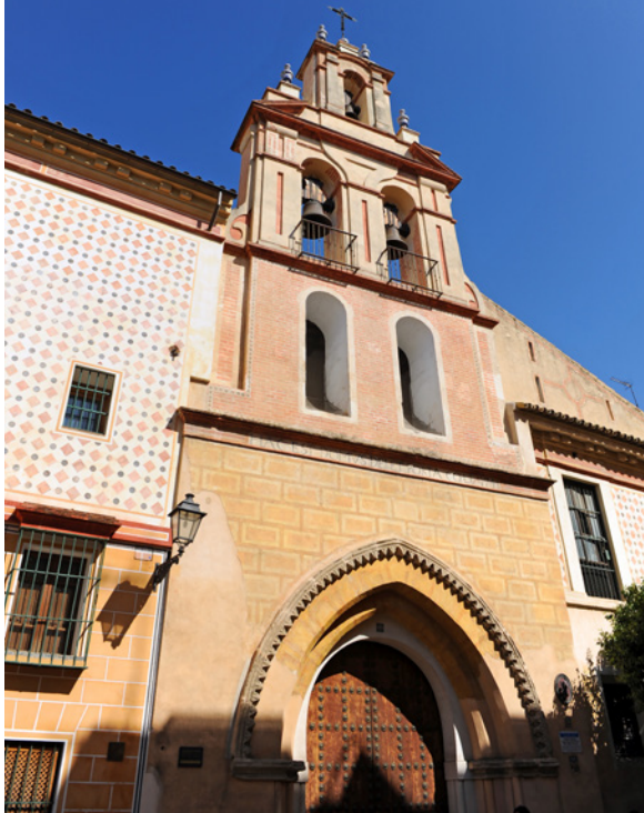
▲ CHIESA DI SANTA MARÍA LA BLANCA SIVIGLIA