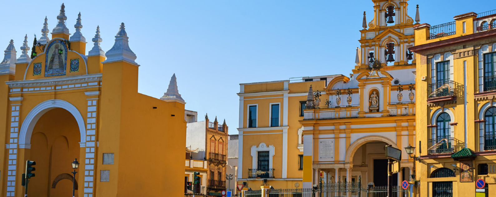
▲ ARCO E BASILICA DI LA MACARENA

Situato a nord del centro storico, La Macarena è uno dei quartieri più tipici di Siviglia. Quasi un villaggio all'interno della città, con monumenti, leggende e tradizioni proprie.