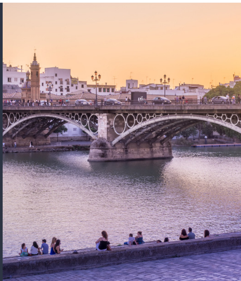
▲ PONTE DI ISABEL II

A Triana troverai inoltre meraviglie dell'architettura come il vicolo della Inquisición , dove si trovano resti dell'antico castello di San Jorge. Nella basilica del Patrocinio puoi ammirare la statua di El Cachorro, figura emblematica della Settimana Santa sivigliana.