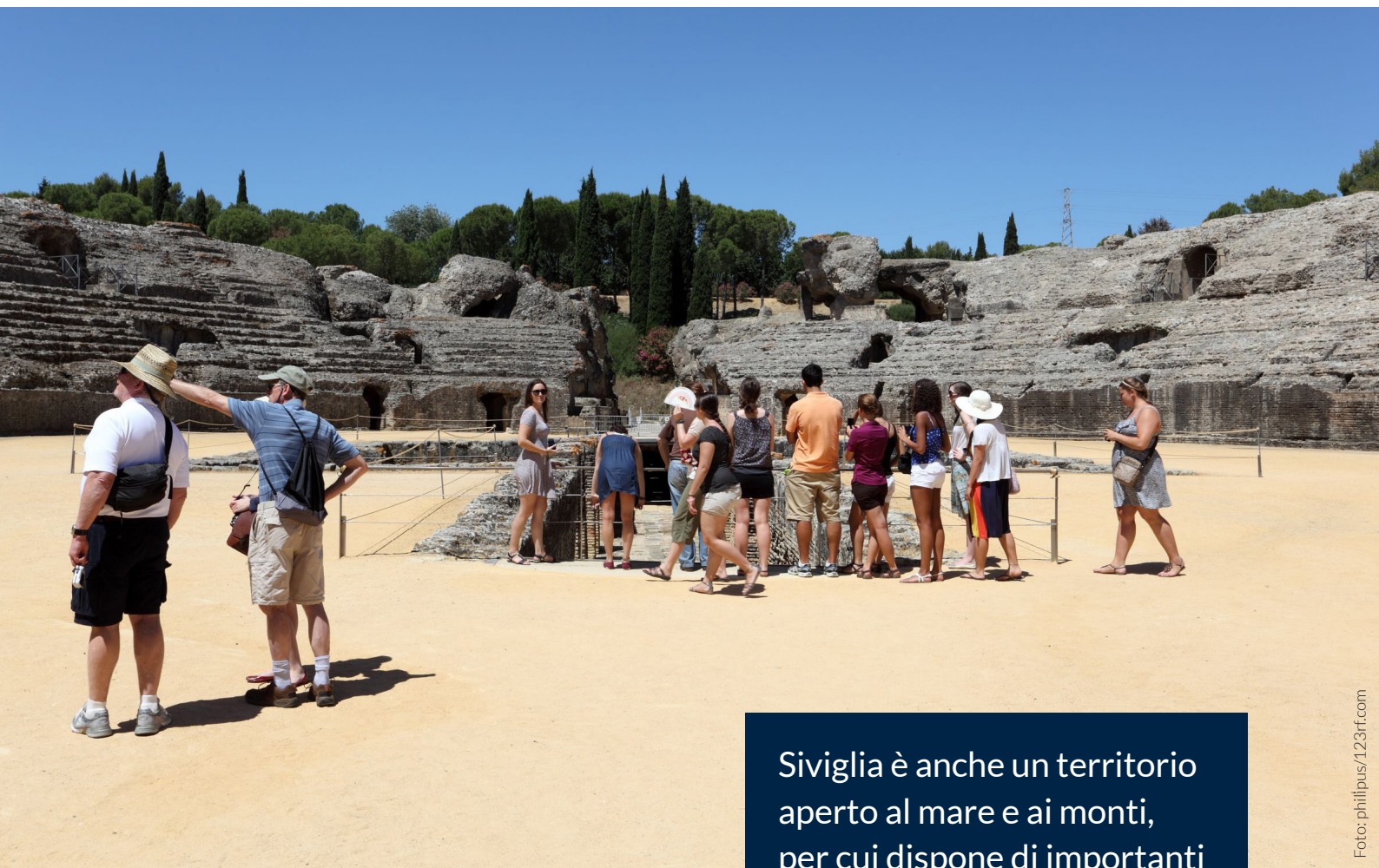
▲ COMPLESSO ARCHEOLOGICO DI ITÁLICA SANTIPONCE

Siviglia è anche un territorio aperto al mare e ai monti, per cui dispone di importanti spazi naturali con tante possibilità.