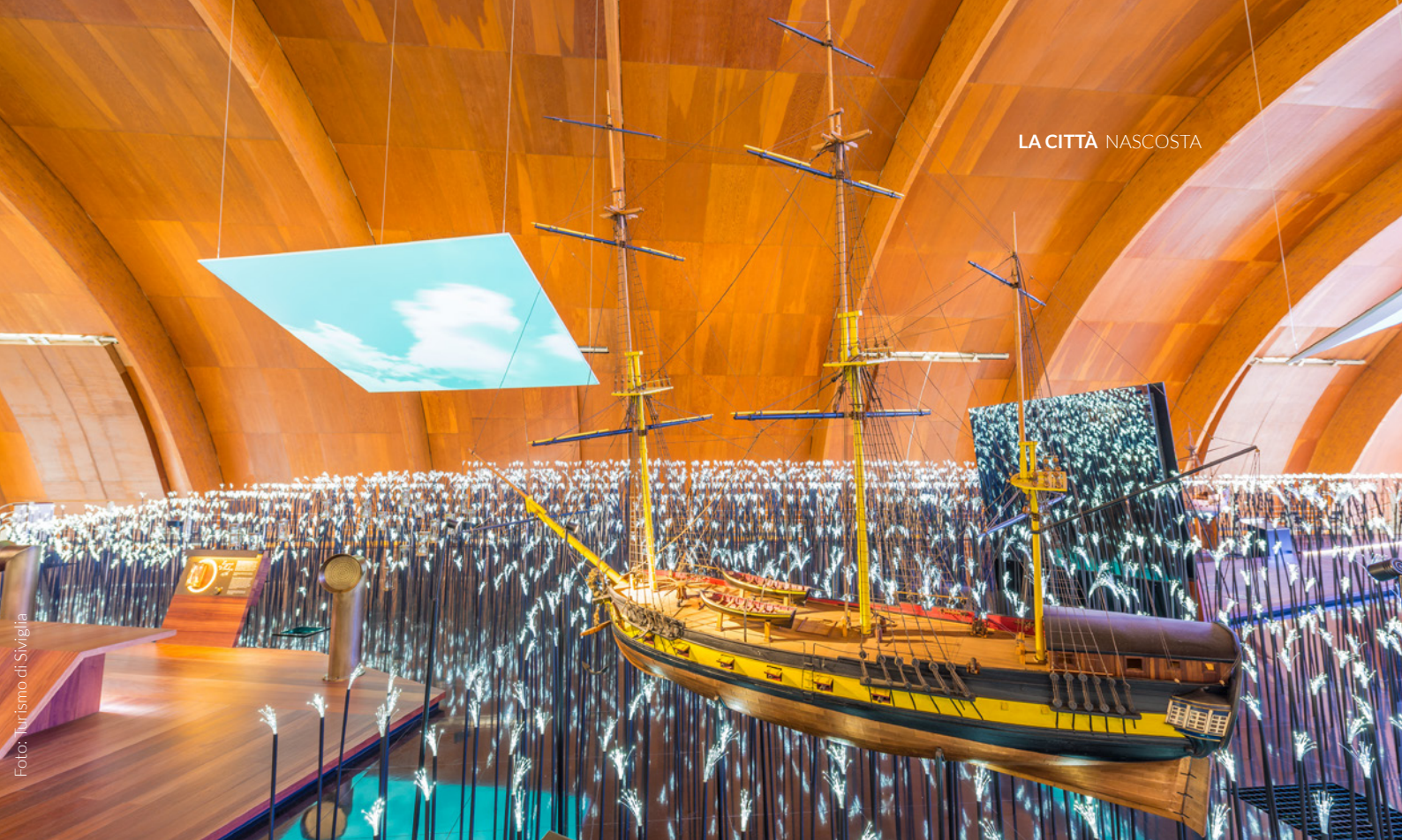
▲ PADIGLIONE DELLA NAVIGAZIONE