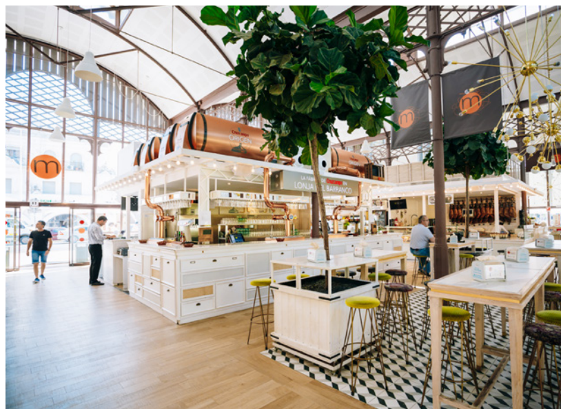
▲ MERCATO-PESCHERIA DEL BARRANCO

Attraversa il ponte di Triana per perderti tra le bancarelle del mercato dell'Arenal . Qui trovi dai locali di cucina tradizionale a base di prodotti andalusi e biologici fino alle proposte vegane più creative. Puoi inoltre seguire corsi di degustazione di vini.