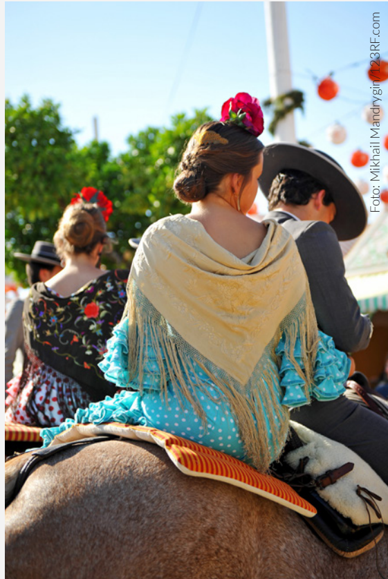
▲ FERIA DE ABRIL SIVIGLIA

L'altro appuntamento importante è la Feria de Abril . È la festa delle feste, che inizia la notte dell'accensione, alumbrao , delle 250.000 lampadine del